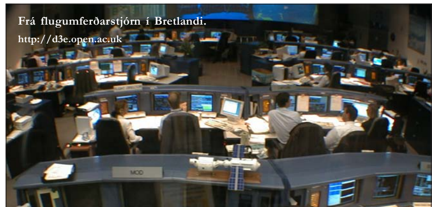
Frá flugumferðarstjórn í Bretlandi.

Félagið réð 8 nýja flugmenn til sumarstarfa fyrr á þessu ári. Þeir af þeim hættu störfum í upphafi september vegna árstíðarsveiflu í rekstrinum. Þeir hafa fengið fastráðningu og tveir flugmenn eru á reynslusamning fram í desember þar sem þjálfun þeirra á Dash vélina hófst ekki fyrr en um mitt sumar. Einsog sakir standa munu þeir láta af störfum að loknum reynslutímanum ef verkefnastaðan breytist ekki. -elm