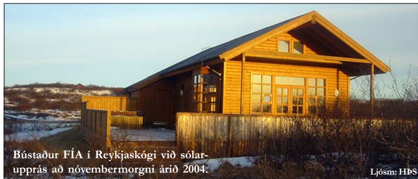
Bústaður FÍA í Reykjaskógi við sólarupprás að nóvembermorgni árið 2004.

Frá síðastliðnu vori höfum við verið með á leigu íbúð á Akureyri. Vel hefur gengið með hana og verðum við með hana á leigu í vetur. Vil ég benda félagsmönnum á að nota hana. Hún er frábærlega staðsett og upplögð til afnota þegar skroppið er norður í helgar- og skíðaferðir í vetur. Verulegar endurbætur voru á Hlíðarfjalli í sumar og tæki til snjögerðar sett upp sem ætti að tryggja betra færi